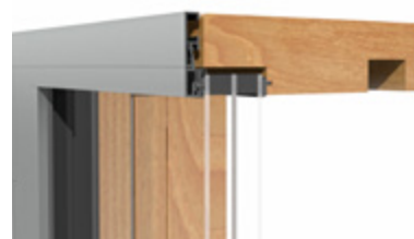
Detailschnitt der „HST“