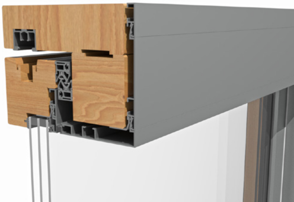
Detailschnitt BUG Hebe-Schiebe-Tür „HST“ mit außen montierter 3-fach Verglasung