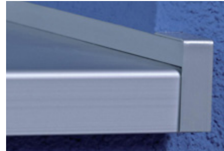
Putzbündig eingebauter Fensterbank-Gleitabschluss A 900 G

Kombinierbar mit allen BUG Fensterbänken und dem schlagregendichten BUG Fensterbank-Stoßverbinder H500D sowie dem Innen- und Außeneckverbinder I500D90/135 und A500D90/135.